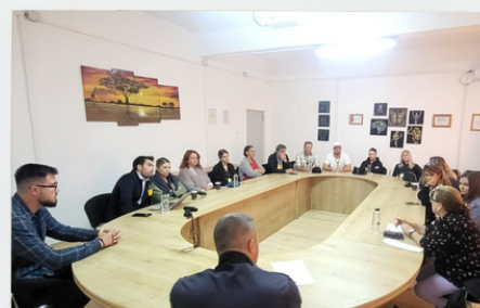
Prigione di Jilava