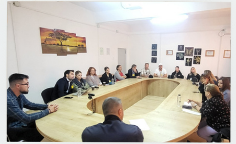
Prison of Jilava

Bu açık diyalog fırsatı son derece değerliydi ve gelecek yıl Reykjavik ve İzmir'de yeniden bir araya gelmek için şimdiden sabırsızlanıyoruz!